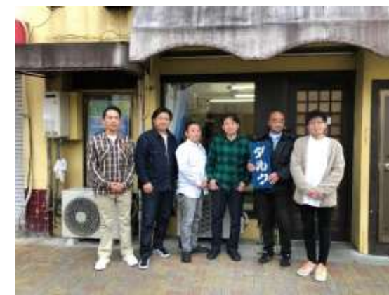
スタッフのみなさん (依存症でお悩みの方、ご家族はお気軽にご相談ください)

■ 場所：北区大曾根 1-16-6 名鉄瀬戸線「森下」徒歩6分 地下鉄「平安通」徒歩11分