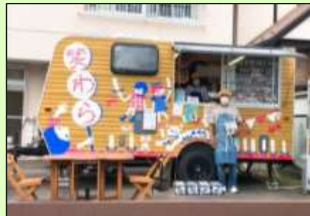
利用者みんなで色を塗り仕上げた かわいらしいお団子屋さん

就労継続支援 B 型事業所 笑わらのお家名城公園(萩永) 住所:〒462-0845 北区柳原 2-2-23 電話:325-7605