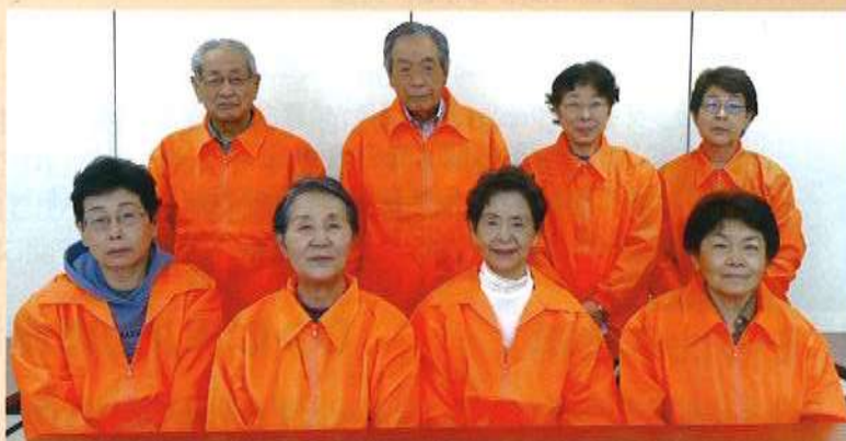
名北学区ボランティアコーディネーターのみなさま

地域支えあい事業は、学区の福祉推進協議会が実施主体となり、高齢者、障がいのある方、子育て中の方等のちょっとした困りごとをご登録いただいたご近所ボランティアさんが解決する事業です。名北学区では、令和2年度に開始を予定していましたが、コロナの影響で延期していましたが、今回コロナを乗り越えての開始となります。