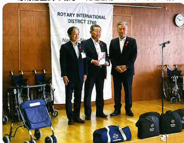
寄附贈呈式の様子（名古屋北ロータリークラブ様）