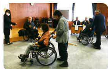
名古屋北ロータリークラブ様から寄贈いただきました「車いす」と「ポッチャ」をサロンのボランティアさん等と使用体験会を行いました。