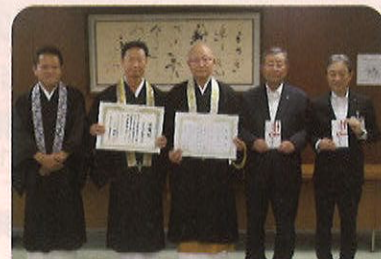
名古屋市北区仏教会様 寄附贈呈式の様子

北区社会福祉協議会では、福祉のまちづくりのために、みなさまからのご寄附をお待ちしております。ご協力をよろしくお願いいたします。