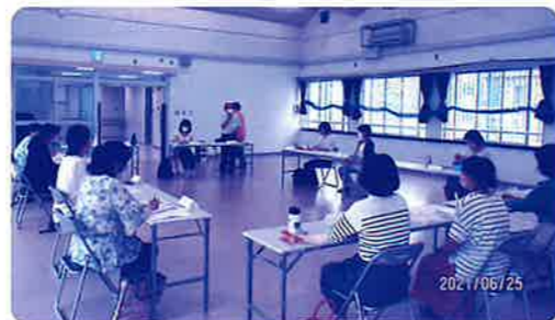
前年度の講座風景