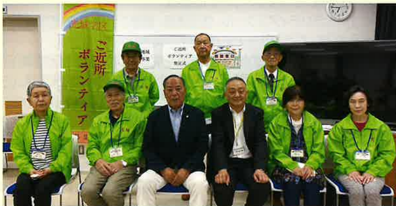
光城学区地域支えあいのみなさま

地域支えあい事業は、学区の福祉推進協議会が実施主体となり、高齢者、障がいのある方、子育て中の方等のちょっとした困りごとを、ご登録いただいたご近所ボランティアさんが解決する事業です。相談窓口を設置し、相談には学区住民であるご近所ボランティアコーディネーターが対応します。気軽にご相談ください。