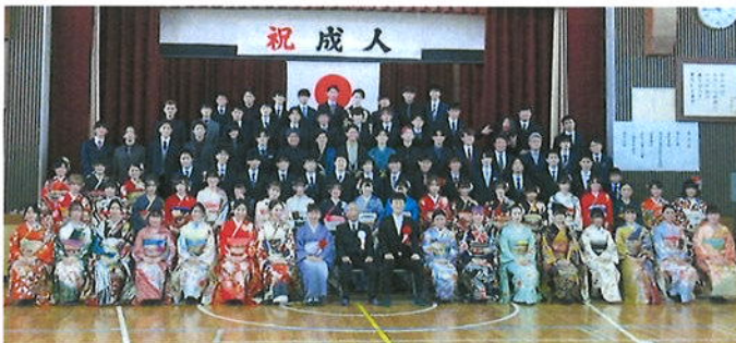
この写真は昨年の集合写真です。