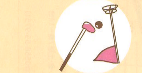
きた 麗子 きた 健太郎