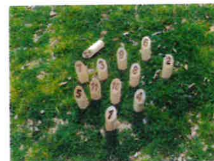
1本の場合「書かれている数字」が点数 この写真は12点