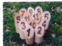
スキットル 各番号の値をみる

令和5年6月18日(日)午後13時30分よりモルックの研修が、大杉小学校 運動場にて、体育委員の皆さんにより行われました。