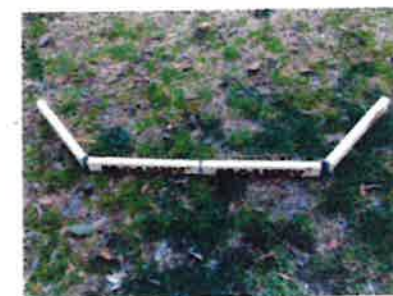
モルックリ 地面に置いてモルックを投げる位置を示すもの