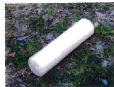
モルック 20cmぐらいの木製の投げる棒