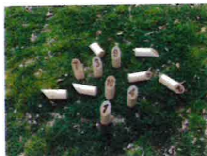
2本以上の場合は「倒れた本数」が点数 この写真は6点