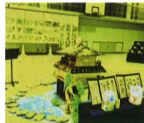
お城の模型と思い出の絵画