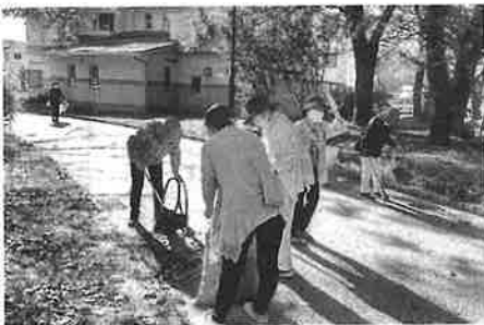
コミセン周辺清掃活動