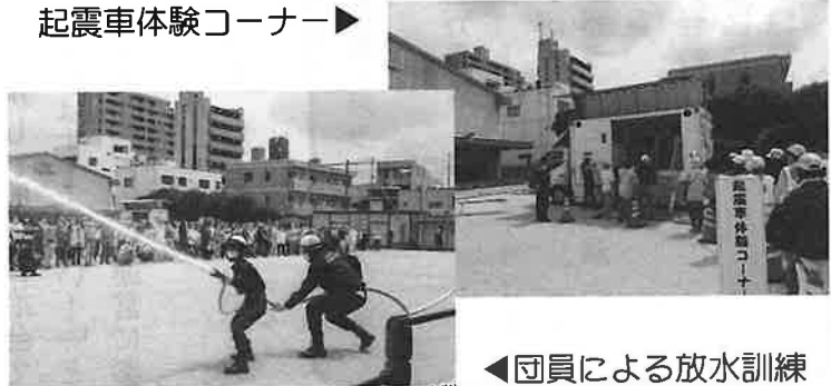
◀団員による放水訓練