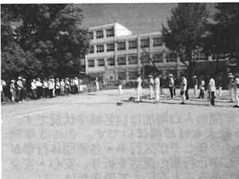
志賀中学校で開催