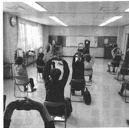
金城コミセンで開催