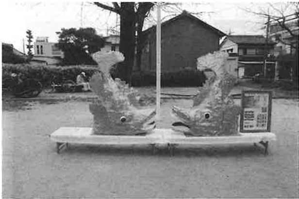
卒業生が作成した金シャチ三年ぶりに披露