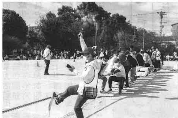
運動会といえば綱引き