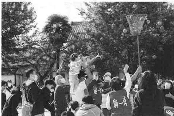
運動会 幼児も参加 玉入れ