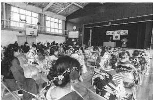
華やかさを取り戻した中の祝辞