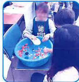
スーパーボールすくいの様子

今後も子ども食堂では、食を通して共有体験を積み重ねていき、子どもたちの豊かな心を育み、温かな輪を広げていきます。みんなで食べるとおいしい!楽しい!子ども食堂に行ってみませんか?