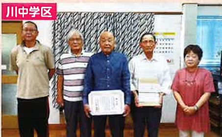
川中学区地域支えあい事業メンバーのみなさま

地域支えあい事業とは、高齢者などのちょっとした困りごとを地域に住むご近所ボランティアの力で解決する事業です。