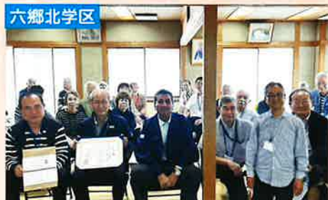
六郷北学区地域支えあい事業メンバーとカフェサロン六郷北参加者のみなさま