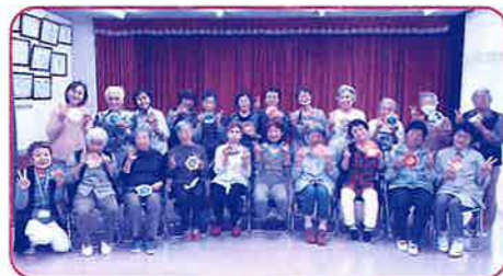
楠西会場のみなさま

※高齢者はつらつ長寿推進事業(フレンドリークラブ)は名古屋市から委託を受けた一般介護予防事業です。週に一度、地域のコミュニティセンターなどに集まって体操や脳トレ・レクリエーションなどの活動しています。お問い合わせは北区社会福祉協議会まで