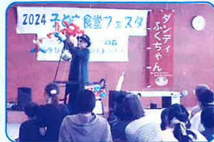
ダンティふくちゃんによる風船大道芸の様子