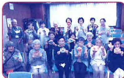
楠会場のみなさま

11/5(火)に、フレンドリークラブ(※)楠・楠西会場と上飯田児童館の合同企画『おじいちゃんおばあちゃん体操をしよう!』を行いました。赤ちゃんとお母さん、フレンドリークラブの参加者が上飯田児童館の体育館に集まり、体操や工作、絵本、パラバルーンなどを一緒に楽しみました。