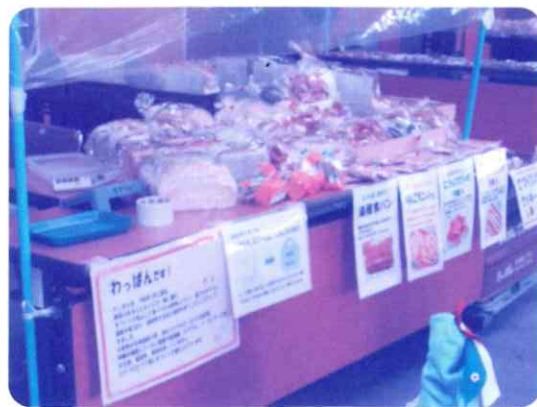
美味しいパンも並びます