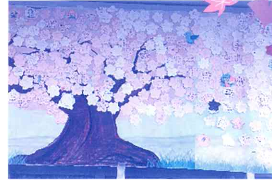
第1弾はサクラを満開にしました

メッセージカードは北区社会福祉協議会の窓口や当日の会場にも用意してありますので、気軽にご参加ください。