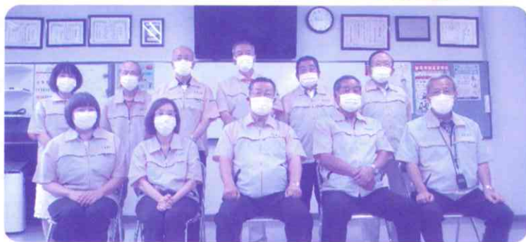
大杉学区地域支えあい事業のみなさま