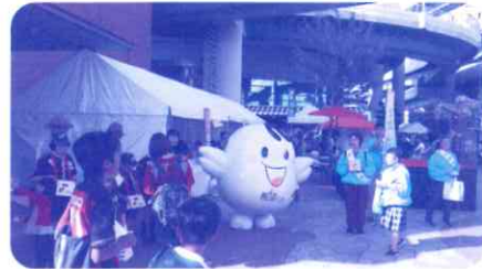
令和元年のきた福祉フェスティバル