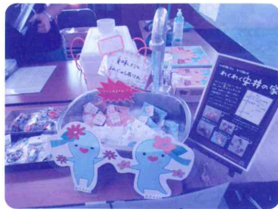
心のこもった手作り作品

セルフとは、英語のSelf-Help「自助自立」から作られた造語です。障がいのある方々が互いに助け合うという自発的で主体的な活動の事をいいます。