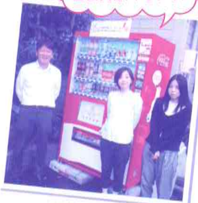
株式会社リクラスのみなさん

【お問い合わせ先】北区共同募金委員会（北区社会福祉協議会内）TEL 915-7435