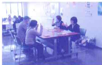
福祉体験では手話に挑戦!

次回のプチサロンは令和4年3月1日(火)午前11時～午後2時を 予定していますのでぜひ遊びに来てください!!