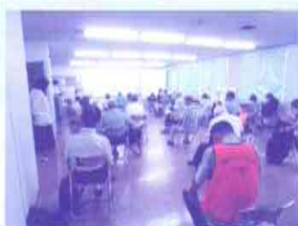
初日の公開講座は、参加者35名程