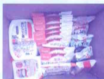
参加者へ防災食の配布