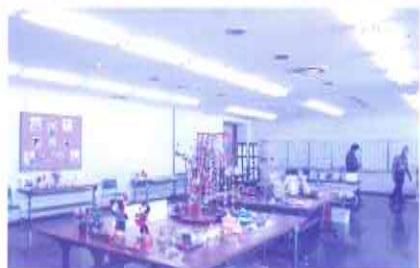
ふれあい・いきいきサロンの展示作品

当日は300人を超える多くのみなさまにご来場いただき、ありがとうございました。 今回もたくさんの福祉の店が参加しました。会場では各事業所でセルフ製品を作っている作業風景を放映し、活躍するみなさんの姿を紹介させていただきました。 また、ふくし体験ブースでは、点字や手話に触れて、貴重な体験ができたのではないのでしょうか。北マジックサークルによるマジックショー、フレンドリークラブやサロンの作品展など、地域のみなさんによる活気あふれるプチサロンとなりました!