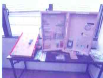
家具転倒防止グッズ