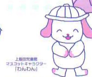
上飯田児童館 マスコットキャラクター 「わんわん」