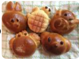
一番人気の ミニ動物パンセット ¥390

ワークショップすずらん ☎ 052-915-9672 (本工場) ソーネショップ ☎ 052-910-1002 (店舗)