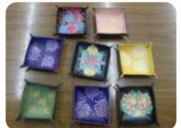
革のトレイ (大) (小) 500円~600円

どんぐりの家では、主に精神障がいのある人たちが、住みなれた地域で自分らしく生き生きとした毎日を送ることをめざして活動しています。どんぐりの家では和紙・布・革製品・雑貨などを作っています。