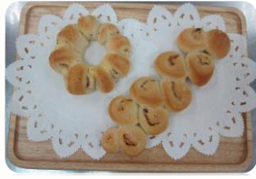
ベーコン ベーコン チーズ エビ

天然酵母と国産小麦を使用し安全・安心で美味しい商品づくりを心掛けてきました。卵・バターを使わない商品もあります。