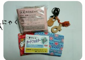
木工手作りアクセサリー 350円 布製カードフォルダー 800円