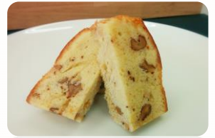
パウンドケーキ各種 280円 その他焼き菓子 230~380円

内容は軽作業や畑、木工、手芸、アートなど。これらMO-YA-COの焼き菓子販売や、レクリエーション、ダンスなど楽しく豊かに過ごしています。