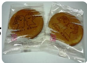
ふくちゃんきたちゃんせんべい 2枚入り 100円 8枚入り 400円

あたたかく受け入れていただき生活介護事業所ぼちぼちを運営しております。軽作業を中心に造形、大正琴、リトミックなど自分の思いが出せるよう社会のルールを学びながら過ごしています。