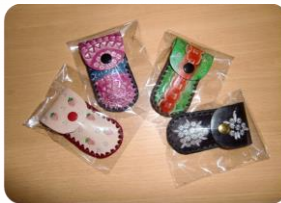
印鑑2本入ります 印鑑ケース 500円

どんぐりの家では、主に精神障がいをもつ人たちが、住みなれた地域で自分らしく生き生きとした毎日を送ることをめざして活動しています。どんぐりの家では和紙・布・革製品・雑貨などを作っています。