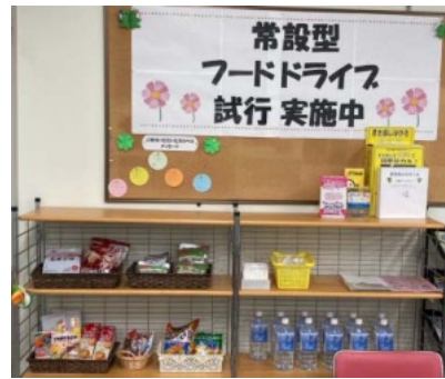
北区役所1階 北区在宅サービスセンター内