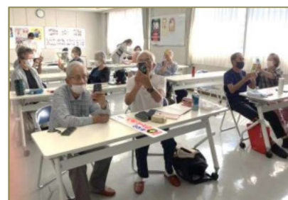
上手に撮れたかな？