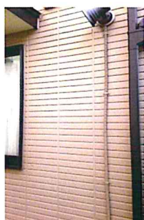
敷地内外灯の電球交換