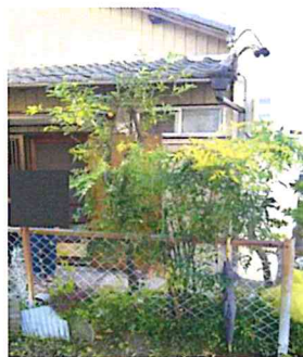
電線のぶら下がり

長年手入れがされず、樹木や笹がびっしり張り付いていました。バツサリ剪定・間引きで風通しと明るさが戻りました。