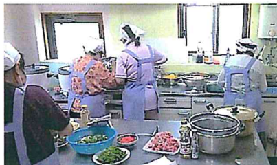
調理中の民生委員さん →