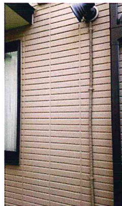
←大きな蜂の巣 高いところの外灯↑