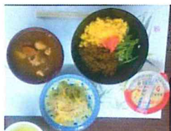
←三食丼、トン汁、酢の物、デザート