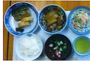
焼き鯖、肉と大根の煮汁、サラダ、吸い物

九月二十七日は「いきいきクラブ」65歳以上参加費無料。高齢の方に元気を届けます。今回は介護用品の話と歌声で交流を深めました。