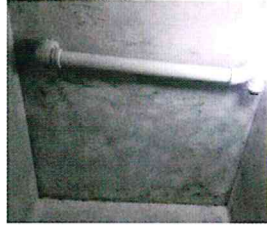
風呂天井のカビ↑ ←電線のぶら下がり