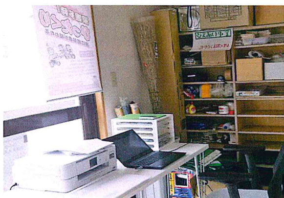
川中集会所支えあい相談室