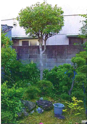
高い樹木の剪定にお困りでした

「思いでの深い『植木鉢』、植替えもむつかしくなりましたが、枯らしてしまうのは残念です。「支えあい」で助けていただければありがたいです」