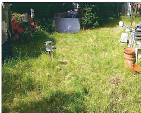
芝生の手入れの依頼を受けました

技能が伴うので、完全ボランティアでは難しいとも思います。現在、「北社協」と何らかの方法で期待にこたえられないか検討中です。