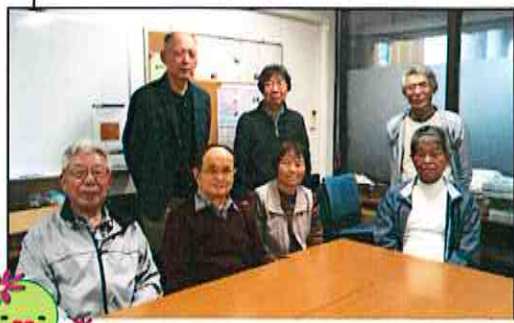
社会奉仕活動委員会のみなさん

活動されている方からは、「個人でボランティアを始めるのは難しいが、組織を通じ紹介いただいたことで、活動につながりました。活動(社会参加)を続けるうちに、少しでも元気に生活できる期間を延ばしたいと思うようになりまし