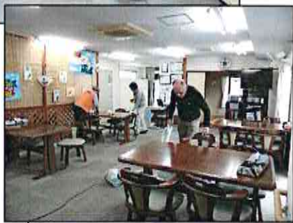
杉村デイサービスでの清掃の様子