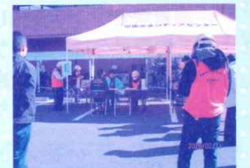
昨年の訓練の様子