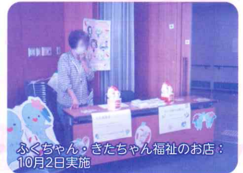
ふくちゃん・きたちゃん福祉のお店：10月2日実施