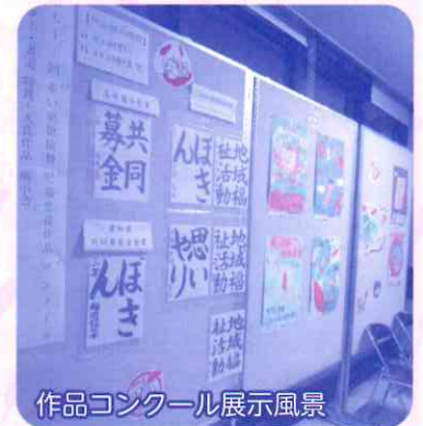
作品コンクール展示風景