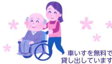
車いすを無料で貸し出しています