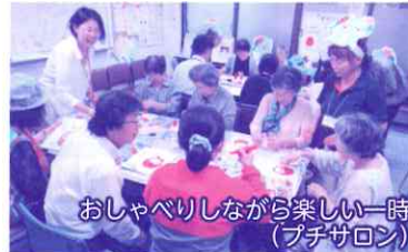
おしゃべりしながら楽しい一時(プチサロン)