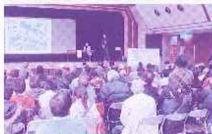
(昨年度の報告会の様子)