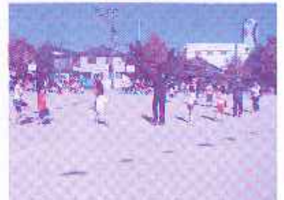
〈かわなかニコニコ音頭の様子〉