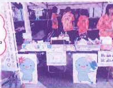
きた福祉フェスティバル本部(上) 愛知学院(下)での販売の様子