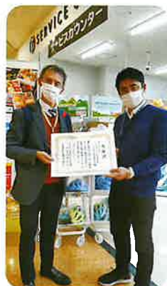
▲ 写真：アピタ名古屋北店様へ感謝状の贈呈（前号にて紹介）