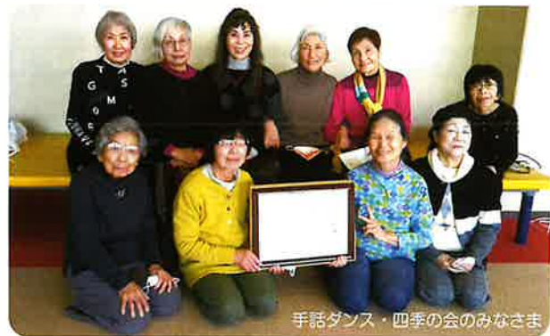
手話ダンス・四季の会のみなさま

「市長感謝」として、北区では、 2つのボランティア団体が受賞されました。 これまでの取り組みについてインタビュー をしました。