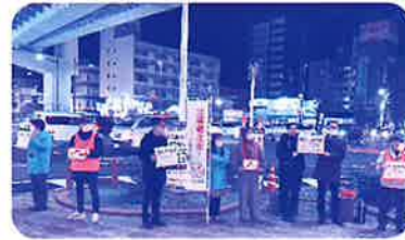
北区役所・北区社会福祉協議会の職員有志による街頭募金の様子